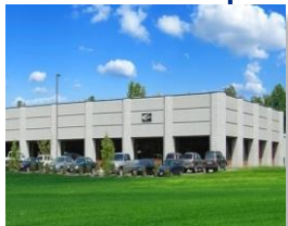
Cleveland, Ohio 2000年設立