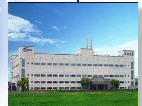
Zhong-Li, Taiwan 2000年設立