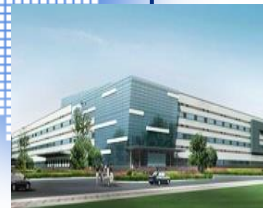
Zhong-shan, China 2011年設立