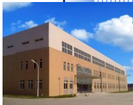
Su-zhou, China 2004年設立