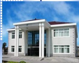
Shang-hai, China 1993年設立