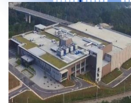
Tong-uo, Taiwan 2013年設立