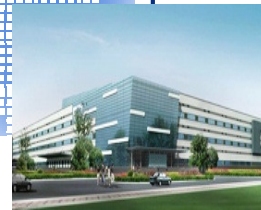
Zhong-shan, China 2011年設立