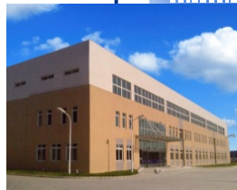
Su-zhou, China 2004年設立