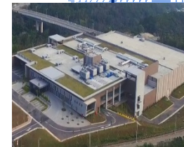
Tong-uo, Taiwan 2013年設立