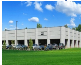
Cleveland, Ohio 2000年設立