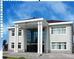
Shang-hai, China 1993年設立