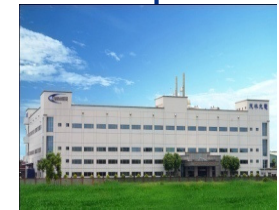
Zhong-Li, Taiwan 2000年設立